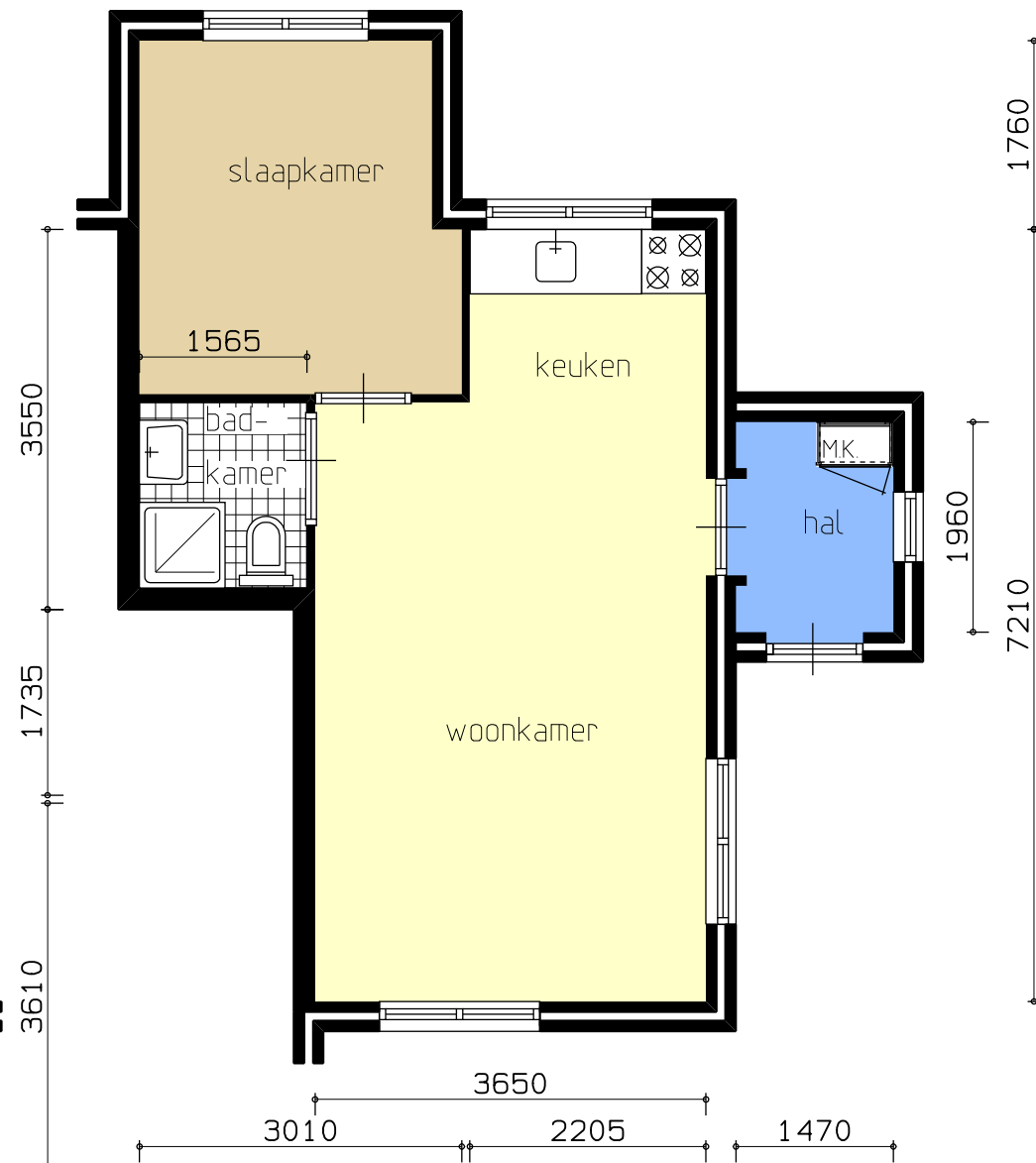
TYPE A gespiegeld